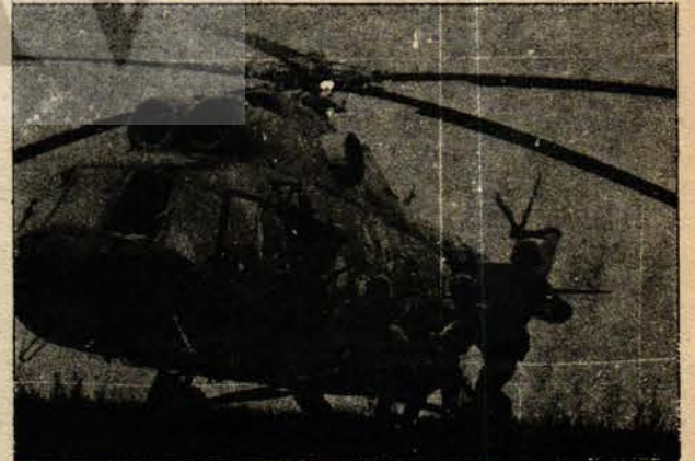
Sovyet hücum birlikleri manevrada

Artık, Batı Avrupa ülkeleri Sovyet revizyonistlerinin yayılma ve tehditlerini boşa çıkarmak için uyanık davranmaya ve ortak mücadeleye başlamışlardır. Bu tarihî eğilim önüne geçilmez bir haldedir.